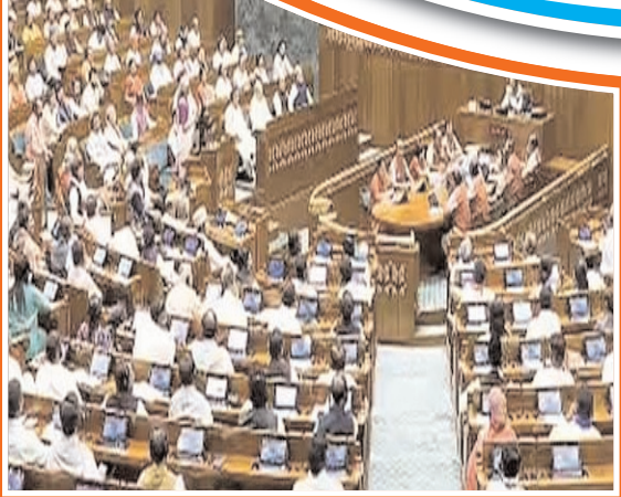
ఏనుగుల గర్వకారణం.. నిత్యం వాయిదాలతోనే

వ్యవహరిస్తామని, బాధ్యులైన వారిని చట్టప్రకారం శిక్షిస్తామని ముఖ్యమంత్రి హెచ్చరించారు. వసతిగృహాల్లో ఆహారం విషయంలో కొందరు ఉద్దేశపూర్వకంగా పుకార్లు సృష్టించడంతో పాటు లేని వార్తలను ప్రచారం చేస్తూ విద్యార్థుల తల్లిదండ్రుల్లో భయాందోళనలు సృష్టిస్తున్నారని.. వారిపైనూ కఠిన చర్యలు తీసుకోవాలని అధికారులను ముఖ్యమంత్రి ఆదేశించారు.