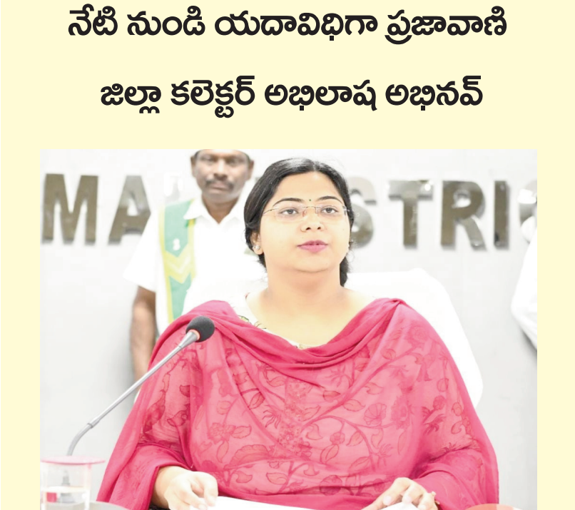
నిర్మల్ ప్రతినిధి ( మన వెలుగు ) నవంబర్ 24 : ప్రతి సోమవారం నిర్వహించే ప్రజావాణి గత రెండు వారాలుగా సమగ్ర ఇంటింటి కుటుంబ సర్వే సందర్భంగా రద్దు చేయడం జరిగింది. నేటి నుండి ప్రజావాణి యదా విధిగా కొనసాగుతుందని జిల్లా కలెక్టర్ అభిలాష అభినవ్ ఒక ప్రకటనలో తెలిపారు. అల్లదారులు ఈ విషయాన్ని గమనించగలరని కలెక్టర్ ఆ ప్రకటన తెలిపారు.

హెచ్చరిస్తున్నారు. కనుక గోధుమలను చపాతీలు లేదా రవ్వ ఎలాగైనా సరే తక్కువ మోతాదులో తినాలని అంటున్నారు. అయితే బరువు పెరుగుతామేమోనని భయపడి కొందరు వీటిని తినడమే మానేస్తుంటారు. ఇలా కూడా చేయవద్దని వైద్యులు చెబుతున్నారు. చపాతీలు లేదా గోధుమ రవ్వను మోతాదులో తింటే ఆరోగ్యానికి ప్రయోజనాలు కలుగుతాయని అంటున్నారు. చపాతీలను లేదా గోధుమ రవ్వను మరి అతిగా తినకూడదు. తింటే బరువు పెరిగిపోతారు. ఇక గోధుమల్లో ఆక్సలేట్స్ అధికంగా ఉంటాయి. కనుక కిడ్నీ సమస్యలు లేదా కిడ్నీ స్టోన్స్ ఉన్నవారు చపాతీలను లేదా గోధుమ రవ్వను అతిగా తినకూడదు. వీరు అసలు గోధుమలను తినడం మానేస్తేనే మంచిది. లేదంటే కిడ్నీ స్టోన్స్ సమస్య ఎక్కువయ్యే అవకాశాలు ఉంటాయి. దీంతోపాటు టిప్ర అనారోగ్యాల బారిన పడే ప్రమాదం కూడా ఉంటుంది. కనుక వీరు గోధుమలను అసలు తినకూడదు. ఇక గోధుమల్లో ఫైబర్ ఎక్కువగా ఉంటుంది కనుక ఇవి జీర్ణం అయ్యేందుకు సమయం పడుతుంది. కనుక గ్యాస్, కడుపు ఉబ్బరం, అసిడిటీ, మలబద్దకం వంటి సమస్యలు ఉన్నవారు గోధుమలను తినకూడదు. అయితే చపాతీలను రాత్రి తయారు చేసి ఉదయం తింటే మంచిదని కూడా కొందరు భావిస్తుంటారు. కానీ ఇది ఎంత మాత్రం మంచిది కాదని, నిల్వ ఉంచిన ఏ ఆహారం అయినా సరే అందులో బాక్టీరియా అధికంగా ఉంటుంది కనుక అలాంటి ఆహారాలను తింటే ఫుడ్ పాయిజన్ గా బారిన పడే ప్రమాదం ఉంటుందని, కనుక అసలు సమస్యలు కూడా తినకూడదని వైద్యులు సూచిస్తున్నారు. అయితే చపాతీలను పూర్తిగా మానేయడం మంచిది కాదు, అలాగని చెప్పి మరే అతిగా కూడా తినకూడదు. ఏ ఆహారం అయినా సరే మోతాదులో తింటేనే ప్రయోజనాలు కలుగుతాయన్న విషయాన్ని గుర్తుంచుకోవాలి. మరి అతిగా తినడం ప్రమాదాలను కలిగిస్తుందని తెలుసుకోవాలి. మోతాదులో తింటే