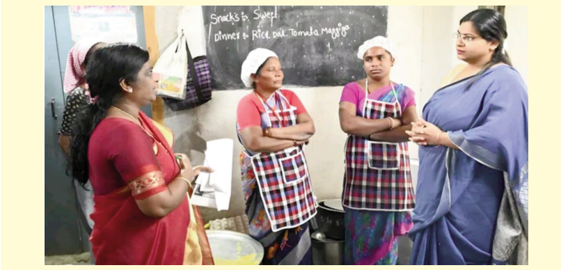
నిర్మల్ ప్రతినిధి ( మన వెలుగు ) నవంబర్ 24 : ప్రభుత్వ వసతి గృహాల్లో విద్యార్థులకు మెరుగైన సదుపాయాలను అందించాలని నిర్మల్ జిల్లా కలెక్టర్ అభిలాష అభినవ్ అధికారులకు ఆదేశించారు. శనివారం మామడ వసతి గృహంలో విద్యార్థులకు కనీస వసతులు కల్పించడంలో నిర్లక్ష్యం చేయడం వలన కేజీబీఐ అధికారికి మరియు మండల ఎంపీడీఓకు షాకన్ నోటీసులు జారీ చేసిన నిర్మల్ జిల్లా కలెక్టర్. ప్రభుత్వ వసతి గృహాల్లో విద్యార్థులకు మెరుగైన ఆహారాన్ని అందించాలని కలెక్టర్ గారు ఆదేశించారు.