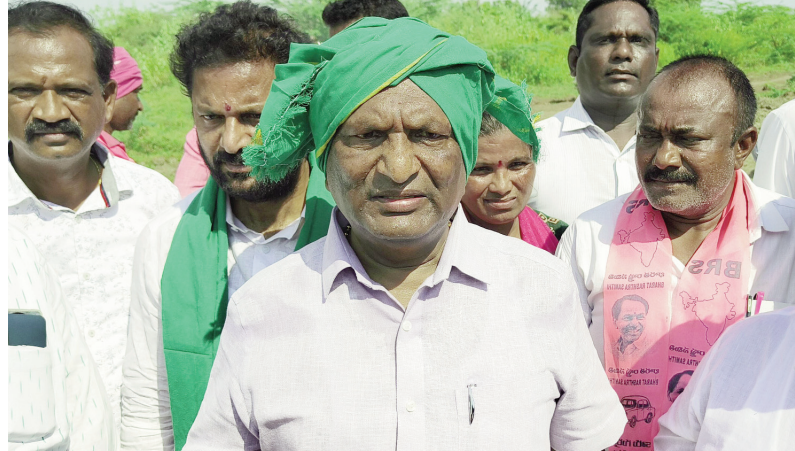
ప్రభుత్వం ఏ ఒక్క కార్యక్రమాన్ని అమలు చేయకుండా మాయమాటలు దొంగ మాటలు చెప్పి తప్పించుకుంటూ రోజుకోకొక్క మాట, పూటకోకొక్క మాట చెబుతున్న ముఖ్యమంత్రిగా ఆయన్నే చూస్తున్నారన్నారు.