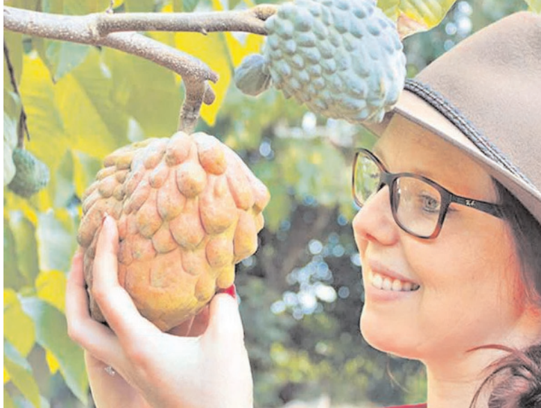
పూతల తయారీలోనూ వాడతారు. రావణాసురుడు ఎత్తుకుపోయేటప్పుడు సీతపు ధారాపాతంగా ఏడవడం వల్ల నేల మీద పడ్డ కన్నడి బొట్ట నుంచి ఈ చెట్టు పుట్టడం వల్ల సీతాఫలం అని పిలుస్తారని ఓ జానపద కథ. వనవాస సమయంలో సీతమ్మ ఈ పండ్లను ఇష్టంగా తినడం వల్ల ఆమె పేరు వచ్చిందని మరో గాథ. చలవ చేసే స్వభావం ఉన్నది, చల్లగా ఉండే కాలంలో వచ్చేది కనుక శీతాఫలం అంటారు చెబుతారు.