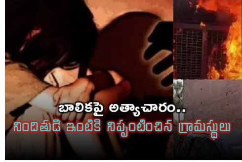
బాలికపై అత్యాచారం.. నిందితుడి ఇంటికి నిప్పుంటించిన గ్రామస్థులు

సిద్దిపేట ప్రతినది ( మన తెలుగు ) సెప్టెంబర్ 29 : అభయభంగం తెలియని బాలికపై అత్యాచారం చేసిన యువకుడిపై గ్రామస్థులు మండిపడ్డారు. ఇదే పనంటూ నిలదీసేందుకు నిందితుడి ఇంటికి వెళ్లారు. అయితే, అప్పటికే సదరు యువకుడు పరారయ్యాడు. దీంతో కోపం పట్టలేక నిందితుడి ఇంటికి గ్రామస్థులు నిప్పు పెట్టారు. పోలీసుల ముందే ఇంటి ముందున్న కార్లను మహిళలు ధ్వంసం చేశారు. పోలీసులు అడ్డుకుంటున్నా ఆగకుండా నిందితుడి ఇంటిపై దాడి చేశారు. సిద్దిపేట జిల్లాలోని కొమురవెల్లి మండలం గురువస్తు పేట గ్రామంలో చోటుచేసుకుంది ఘటన. బాధితులు, పోలీసులు తెలిపిన వివరాల ప్రకారం.. స్థానిక పాఠశాలలో ఏడో తరగతి చదువుతున్న బాలికపై గ్రామానికే చెందిన ఓ యువకుడు అత్యాచారం చేశాడు. ఈ విషయం బాలిక తల్లిదండ్రులకు చెప్పడంతో వారు మండిపడ్డారు. చుట్టూపక్కల వారితో కలిసి నిందితుడి ఇంటికి వెళ్లారు. అత్యాచారం విషయం తెలిసి గ్రామస్థులంతా అక్కడికి చేరుకున్నారు. ఈ విషయం తెలిసి నిందితుడు పరారయ్యాడు. గ్రామస్థులు అందోళన విషయం తెలియడంతో పోలీసులు అక్కడికి చేరుకుని సర్దిచెప్పే ప్రయత్నం చేశారు. అయితే, గ్రామస్థులు వెనక్కి తగ్గలేదు. ఆగ్రహంతో నిందితుడి ఇంట్లో పెట్రోల్ చల్లి నిప్పుంటించారు. ఇంటి ముందు నిలిపిన వాహనాలపై మహిళలు దాడి చేశారు. అడ్డూలు పగలగొట్టారు. దీంతో పోలీసులు లాఠీచార్జి చేసి గ్రామస్థులను చెదరగొట్టారు. బాధితురాలి తల్లిదండ్రుల ఫిర్యాదు మేరకు కొమురవెల్లి పోలీసులు కేసు నమోదు చేసి పరారీలో ఉన్న నిందితుడి కోసం గాలింపు చర్యలు చేపట్టారు.