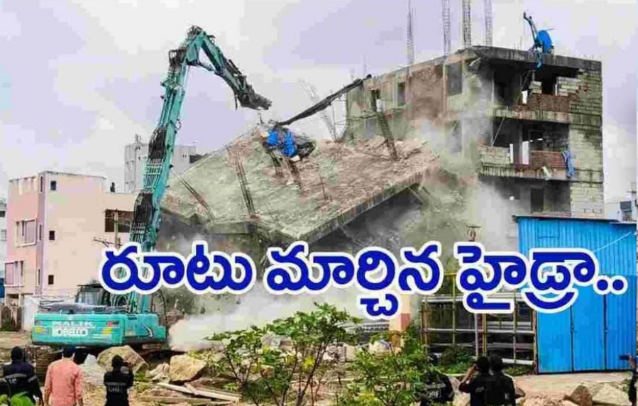
రూటు మార్చిన హైద్రా..

హైదరాబాద్ ( మన తెలుగు ) సెప్టెంబర్ 29 : అక్రమ నిర్మాణమైన జీహెచ్ఎస్సీ, హెచ్ఎండివి అనుమతులు ఉంటే హైద్రా కూల్చివేయరు. అనుమతులు లేని నిర్మాణాలపై మాత్రమే హైద్రా ఛోకర్ పెట్టనుంది. ప్రజల్లో వ్యతిరేకత రావడంతో హైద్రా అవీతాచి అడుగులు వేస్తోంది. ప్రజలకు ఇబ్బందులు లేకుండా కూల్చివేతలు చేయాలని హైద్రా నిర్ణయించినట్లు సమాచారం. హైదరాబాద్ డిజాస్టర్ రెస్పాన్స్ అండ్ ప్రొటెక్షన్ ఏజెన్సీ హైద్రా రూటు మార్చింది. హై స్పీడ్ కూల్చివేతల కీలక నిర్ణయం తీసుకుంది. ఇకపై దూకుడు తగ్గించనుంది. ఈ వీకెండ్ హైద్రా కూల్చివేతల వాయిదా వెనుక గ్రౌండ్ వర్క్ ఉంది. వారాంతం కూల్చివేతలు విమర్శలతో.. ఇక సాధారణ రోజుల్లోనే కూల్చివేతలు చేసే యోచనలో హైద్రా ఉన్నట్లు సమాచారం. అలాగే లీగల్ టీం సలహాలు తీసుకున్న తర్వాతే కూల్చివేతల ప్రక్రియ కొనసాగనున్నట్లు తెలియవచ్చింది. అక్రమ నిర్మాణమైన జీహెచ్ఎంసీ, హెచ్ఎండివి అనుమతులు ఉంటే కూల్చి వేయరు. అనుమతులు లేని నిర్మాణాలపై మాత్రమే హైద్రా ఛోకర్ పెట్టనుంది. ప్రజల్లో వ్యతిరేకత రావడంతో హైద్రా అవీతాచి అడుగులు వేస్తోంది. ప్రజలకు ఇబ్బందులు లేకుండా కూల్చివేతలు చేయాలని హైద్రా నిర్ణయించినట్లు సమాచారం.