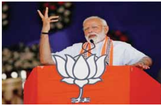
విద్యనందని, ఇక్కడ ఎన్నో ఆలయాల ఉన్నాయని, ఈ అవకాశాన్ని వదులుకోవద్దని, బీజేపీ ప్రభుత్వం ప్రజల సమస్యలన్నింటినీ పరిష్కరిస్తుందని భరోసా ఇచ్చారు.

జమ్మూ తొలి రెండు విడతల పోలింగ్ అనంతరం జమ్మూకశ్మీర్లో తొలిసారి పూర్తి మెజారిటీతో బీజేపీ ప్రభుత్వం అధికారంలోకి రావడం ఖాయమైందని ప్రధాన మంత్రి నరేంద్ర మోదీ అన్నారు. బీజేపీ ప్రభుత్వాన్ని ఇక్కడి ప్రజలు కోరుకుంటున్నారని చెప్పారు. అక్టోబర్ 1న తుది విడత పోలింగ్ నేపథ్యంలో శనివారంనాడిక్కడ జరిగిన ఎన్నికల ప్రచార సభలో మోదీ పాల్గొన్నారు. ఉగ్రవాదం, అవినీతి అంశాలకు సంబంధించి కాంగ్రెస్, దాని భాగస్వామ్య పార్టీ నేషనల్ కాన్ఫెడరేషన్, మెహబూబా ముఖ్తీ సారథ్యంలోని పీడీపీపై విమర్శలు గుప్పించారు.