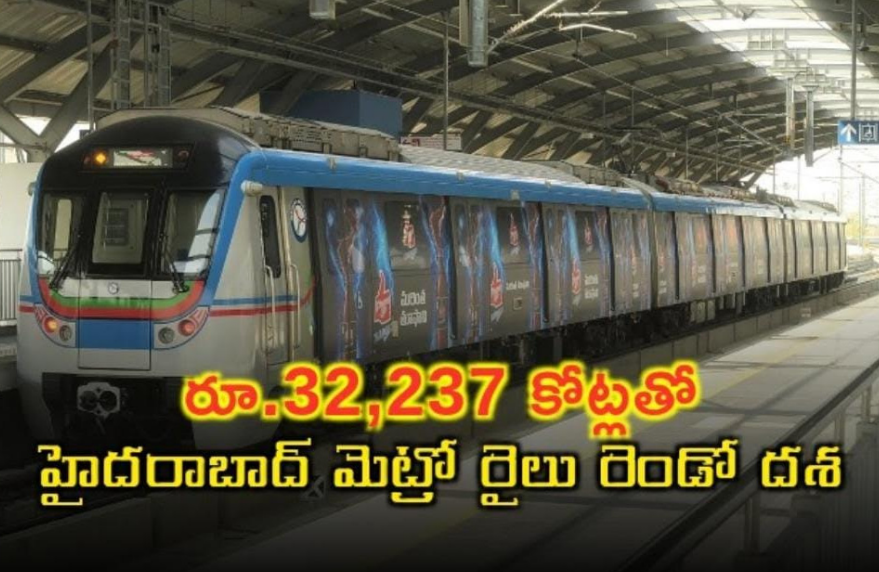
రూ.32,237 కోట్లతో హైదరాబాద్ మెట్రో రైలు రెండో దశ

హైదరాబాద్ ( మన తెలుగు ) సెప్టెంబర్ 29 : హైదరాబాద్ మెట్రో రైలు రెండో దశ పనులను రూ. 32,237 కోట్ల వ్యయంతో చేపట్టనున్నారు. రెండో దశలో కొత్తగా ఏర్పాటువుతున్న పూర్వ సీటీకి మెట్రో రైలు పరుగులు తీయనుంది. మొదటి దశలో మూడు కారిడార్లలో మెట్రో రైలు 69 కిలోమీటర్ల మేర పరుగులు తీస్తోంది. రెండో దశలో మరో 6 కారిడార్లలో 116.2 కిలోమీటర్ల మేర మెట్రో రైలు సేవలు విస్తరిస్తారు. రెండో దశ పూర్తయితే మొత్తం 9 కారిడార్లలో 185 కిలోమీటర్ల పరిధిలో మెట్రో రైలు పరుగులు తీయనుంది. రెండో దశలో ఎయిర్ పోర్ట్ నుంచి స్పిల్ యూనివర్సిటీ వరకు 40 కిలోమీటర్ల మేర మెట్రో రైలు వ్యవస్థను ఏర్పాటు చేయనున్నారు. ఆరాంఘర్-బెంగళూరు రహదారిపై కొత్త హైకోర్టు మీదుగా ఎయిర్ పోర్టుకు మెట్రో రైలు మార్గం ఏర్పాటు చేయనున్నారు. కారిడార్-4లో నాగోల్ నుంచి శంషాబాద్ వరకు 36.6 కిలోమీటర్ల మేర మెట్రో రైలు మార్గానికి ప్రభుత్వ ఆమోదం లభించింది. ఎయిర్ పోర్టు కారిడార్ లో సుమారు ఒకటిన్నర కిలోమీటరు దూరం భూగర్భంలో మెట్రో రైలు ప్రయాణించనుంది. ఫోర్త్ సీటీకి రూ.8 వేల కోట్ల అంచనా వ్యయంతో మెట్రో రైలును తీసుకురానున్నారు. మెట్రో రెండో దశ డివీజన్ లను త్వరలోనే కేంద్రం అనుమతి కోసం పంపనున్నారు.