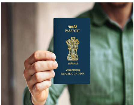
సెప్టెంబర్ 2 నుంచి యథావిధిగా సేవలు అందుబాటులోకి వస్తాయని ఆర్పీవో పేర్కొన్నారు.

హైదరాబాద్, ఆగస్టు 29: దేశ వ్యాప్తంగా గురువారం నుంచి సెప్టెంబర్ 2 వరకు పాస్పోర్టు సేవలకు అంతరాయం ఏర్పడనుంది. నిర్వహణ, సాంకేతిక కారణాలతో పాస్పోర్టు సేవలు నిలిచిపోతాయని ఆర్పీవో స్పష్టత తెలిపారు. అపాయింట్మెంట్లను రీషెడ్యూల్ చేసినట్లు ఆమె వెల్లడించారు. దరఖాస్తుదారులకు నేరుగా సంక్షిప్త సమాచారం పంపామని వెల్లడించారు.