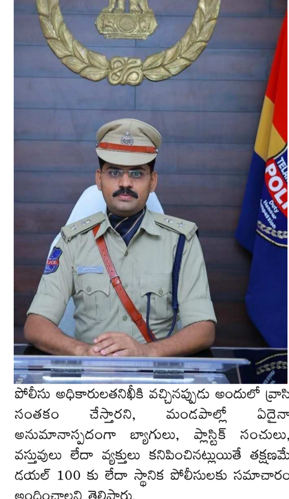
పోలీసు అధికారులతనిఖీకి వచ్చినప్పుడు అందులో వ్రాసిన సంతకం చేస్తారని, మండపాల్లో ఏదైనా అనుమానాన్నదంగా బ్యాగులు, ప్లాస్టిక్ సంచులు, వస్తువులు లేదా వ్యక్తులు కనిపించినట్లుంటే తక్షణమే డయల్ 100 కు లేదా స్థానిక పోలీసులకు సమాచారం అందించాలని తెలిపారు.

ఉపయోగించాలని,గణేష్ మండపాల నిర్వాహ కులు వారి మండపాల కమిటీ వివరాలు, మండపాల బాధ్యత వహించే వారి వివరాలు, ఫోన్ నెంబర్లతో కూడిన షెడ్యూలు మండపంలో ఏర్పాటు చేయాలని,పుద్దులు, చదువుకునే విద్యార్థులకు ఎలాంటి ఇబ్బందులకు కలగకుండా తక్కువ శబ్దాలువ్వంతో స్పీకర్లను ఏర్పాటు చేసుకోవాలని, సుప్రీం కోర్టు ఉత్తర్వుల మేరకు రాత్రి 10 గంటల వరకు మాత్రమే స్పీకర్లను వినియోగించాలని, మండపాల్లో ఎట్టిపరిస్థితులోను డిజేను ఏర్పాటు చేయరాదని, గణేష్ ప్రతిమలు కూర్చుండ బెట్టే ప్రదేశంలో షెడ్ నిర్మాణంలో మంచి నాణ్యత గల షెడ్ ఏర్పాటు చేయాలని, గణేష్ మండపంలో 24 గంటలు ఒక వాలంటీర్ ఉండే విధంగా నిర్వహకులు తగు చర్యలు తీసుకోవాలని,గణేష్ మండపాలకు వచ్చే భక్తుల సందర్శనను దృష్టిలో వుంచుకోని మండపాలలో భక్తుల కోసం క్యూలైన్లను ఏర్పాటు చేయడంతో పాటు వాలంటీర్లను నియమించాలని,గణేష్ మండపాల వద్ద ఎప్పుడైనా అగ్ని ప్రమాదం సంభవించి నష్టము ముందు జాగ్రత్తలో భాగంగా దగ్గరలో రెండు బెట్ల నీళ్లు ఏర్పాటు చేసుకోవాలని,గణేష్ మండపాల వద్ద మద్యం సేవించడం, పేకాట ఆడటం, లక్ష్మి ద్రాలు నిర్వహించడం, అసభ్యకరమైన నృత్యాల ఏర్పాటు, అన్యమతస్తులను కించపరిచే విధంగా ప్రసంగాలు చేయడం, పాటలు పాడటంపై పూర్తిగా నిషేధమని, విధిగా పాయింట్ వున్నకం ఏర్పాటు చేసుకోవాలి,