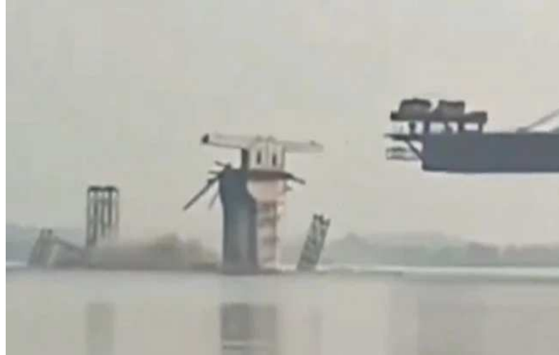
బెగుసరాయ్ ప్రాంతంలో బుర్జి గండక్ నదిపై నిర్మించిన వంతెనలో కొంత భాగం కూలిపోయింది. అదే ఏడాది సమయంలో సీఎం సీతీశ్ కుమార్ సొంత జిల్లా నలందలో నిర్మాణంలో ఉన్న వంతెన కూలిన ఘటనలో ఒక కూలి చనిపోగా, మరో వ్యక్తికి తీవ్రంగా గాయాలయ్యాయి. అంతకుముందు కిషన్ గంజ్, సహార్ సా జిల్లాలో ప్రారంభానికి ముందే రెండు వంతెనలు కూలిపోయాయి.

పట్నం: బిహార్ లో నిర్మాణంలో ఉన్న ఓ వంతెన కూలిపోయింది. ఈ ఘటనలో ఎవరికీ గాయాలు కాలేదని అధికారులు వెల్లడించారు. బిహార్ లోని ఖారీయా జిల్లాలో గంగా నదిపై ఆగువాని సుల్తాన్ గంజ్ గంగా పేరుతో నిర్మిస్తున్న ఈ బ్రిడ్జ్ లో ఓ భాగం ఒక్కసారిగా గంగానదిలో కూలిపోయింది. వంతెన కూలుతున్న సమయంలో అక్కడే ఉన్న స్టానికులు ఆ దృశ్యాలును రికార్డు చేశారు. ప్రస్తుతం ఆ వీడియోలు సామాజిక మాధ్యమాల్లో వైరల్ గా మారాయి. ఈ వంతెనకు ప్రమాదం జరగడం ఇది మూడోసారి. గతేడాది ఏప్రిల్ లో తుఫాను కారణంగా వంతెన పిల్లర్లు కొంతభాగం కుప్పకూలిపోగా తిరిగి నిర్మాణం చేపట్టారు. దీని నిర్మాణం కోసం బిహార్ ప్రభుత్వం రూ. 1,17,17 కోట్లు కేటాయించింది. 2015లో సీతీశ్ కుమార్ ఖారీయా ప్రాంతాల మధ్య గంగా నదిపై ఈ వంతెన నిర్మాణానికి శంకుస్థాపన చేశారు. 2020 నాటికి ఈ వంతెన నిర్మాణం పూర్తికావాల్సి ఉండగా ఇప్పటికీ పూర్తికాలేదు. ఒకే వంతెన నిర్మాణం పూర్తికాకముందే మూడుసార్లు కూలడంతో నిర్మాణంలో నాణ్యత, ప్రాజెక్టు అమరికపై తీవ్ర విమర్శలు వ్యక్తమవుతున్నాయి. నిర్మాణంలో ఉన్న వంతెన మూడుసార్లు కూలిపోవడంతో ప్రతిపక్షాలు సీతీశ్ కుమార్ ప్రభుత్వంపై విమర్శలు గుప్పిస్తున్నాయి. దీనిపై స్పందించిన ప్రభుత్వం నిర్మాణం చేపడుతున్న ఎస్ కే సింగ్ కన్స్ట్రక్షన్ ప్రైవేట్ లిమిటెడ్ కు జరిమానా విధించింది. వంతెనను సొంత ఖర్చుతో పునర్నిర్మించాలని ఆదేశించింది. 2022 డిసెంబర్ లో కూడా బిహార్ లోని