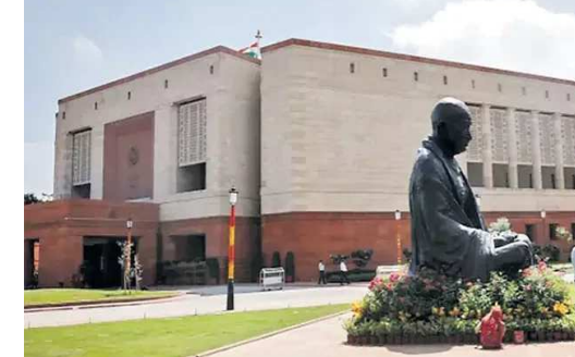
పదిలి భయభ్రాంతులకు గురిచేశారు. అదే సమయంలో పార్లమెంట్ వెలుపల కూడా ఇద్దరు వ్యక్తులు ఇదే రకమైన నిరసనను చేపట్టారు. ఈ ఘటన తర్వాత పార్లమెంట్ లో భద్రతను మరింత కట్టుదిట్టం చేశారు. సీఐఎస్ఎఫ్ సిబ్బందిని మోహరించి భద్రతను పర్యవేక్షిస్తున్నారు.

నిందితుడిని ఉత్తరప్రదేశ్ కు చెందిన మసీద్ గోడ దూకి పోలీసులు గుర్తించారు. ఎత్తుగా ఉన్న గోడను అతడు ఎలా ఎక్కాడు? ఎందుకు పార్లమెంట్ ప్రాంగణంలోకి ప్రవేశించాడన్న దానిపై దర్యాప్తు చేస్తున్నారు. నిందితుడి మానసిక పరిస్థితి సరిగా లేదని ప్రాథమికంగా గుర్తించినట్లు పోలీసులు వెల్లడించారు. సీసీటీవీ ఫుటేజీను పరిశీలిస్తున్నామని తెలిపారు. గతేడాది పార్లమెంట్ శీతాకాల సమావేశాల వేళ లోక్ సభలోకి ఇద్దరు దుండగులు దూసుకొచ్చిన సంగతి తెలిసిందే. పార్లమెంట్ కు గ్రగదాడి జరిగి 22 ఏళ్లు అయిన డిసెంబరు 13న ఆ ఘటన చోటుచేసుకోవడం తీవ్ర కలకలం రేపింది. లోక్ సభలోని పబ్లిక్ గ్యాలరీ వద్ద కూర్చున్న ఇద్దరు యువకులు సభలోకి దూకి గండరగోళం సృష్టించారు. రంగుల పాగను