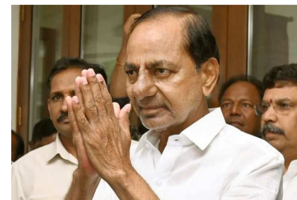
గెలవడానికి ఎలాంటి అప్రలవైనా ఉపయోగించేందుకు రాజకీయ పార్టీలు వెనుకాడవు. అయితే కాంగ్రెస్ పార్టీ కూలుతుందని బీజేపీ-బీఆర్ఎస్ నేతలు చెప్పడం రానున్న రోజుల్లో ఈ రెండు పార్టీల మైత్రికి ఇదేమైనా నాందియాలని అనుమానాలు తలెత్తుతున్నాయి. బీజేపీకి ప్రధాన శత్రువు జాతీయ స్థాయిలో కాంగ్రెస్ మాత్రమే. బీఆర్ఎస్

లేదు. ఈ క్రమంలోనే స్థానిక ఎన్నికల తర్వాత రాష్ట్రంలో గందరగోళ రాజకీయాలు ఉంటాయని ఛోటామోటా నేతలు కార్యకర్తలకు సర్దిచెబుతున్నారు. కాంగ్రెస్ ప్రభుత్వం కూలే సూచనలు ఉన్నట్లు చెబుతున్నారు. 104 మంది ఎమ్మెల్యేలు ఉంటేనే బీజేపీ తన ప్రభుత్వాన్ని కూల్చే ప్రయత్నం చేసినదని, 64 స్థానాలున్న కాంగ్రెస్ ను కూల్చడం పెద్ద కష్టం కాదని సూచిస్తున్నారు. కేసీఆర్, హరీశ్ రావు, ఎర్రబెల్లి దయాకర్ రావు లాంటి నేతలు కొద్ది రోజుల్లోనే కాంగ్రెస్ ప్రభుత్వం కూలుతుందని, రేవంత్ రెడ్డి బీజేపీలో చేరడం ఖాయమని ప్రచారం చేశారు. ఇదంతా చూస్తుంటే పార్టీ క్యాడర్ ను, లీడర్లను కాపాడుకోవడంతో పాటు కార్యకర్తలను కాపాడుకోనే వ్యూహంతోనే బీఆర్ఎస్ నేతలు ఈ మైండ్ గేమ్ కు సిద్ధమయిస్తున్నారని తెలుస్తోంది. ఎన్నికల్లో